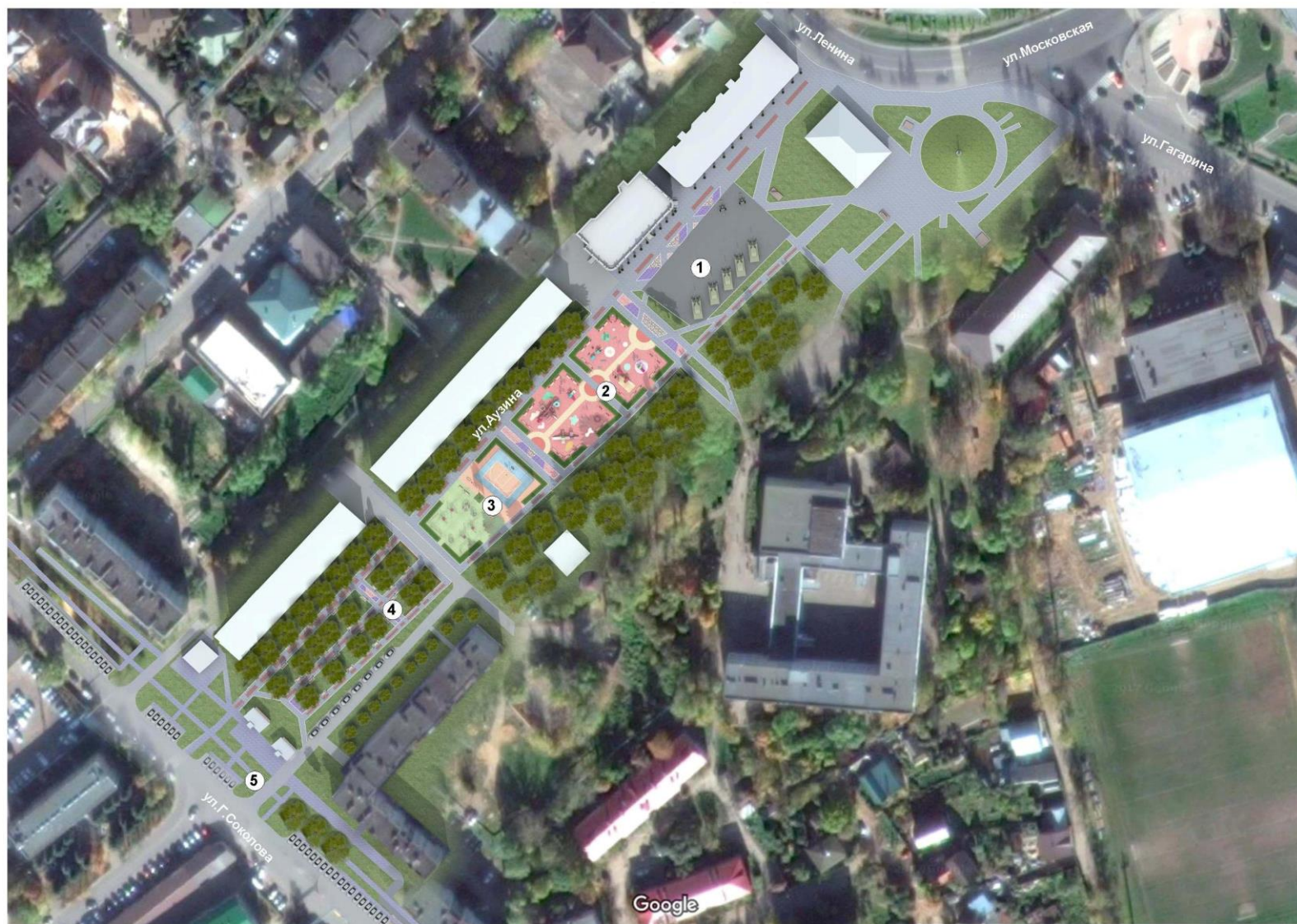
Ведомость объектов благоустройства