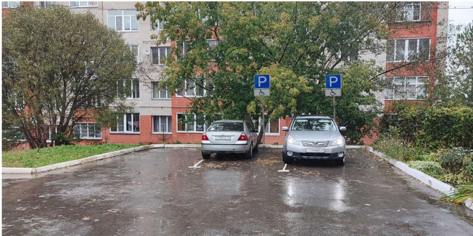
Схема обустройства парковочных мест для инвалидов во дворе многоквартирного дома ул. Почтовая, д. 6, г. Малоярославец